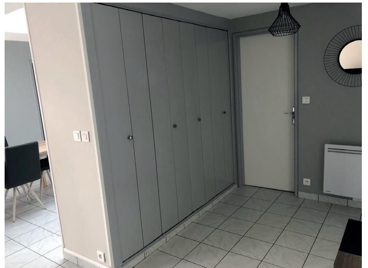
Hall d'entrée / placard