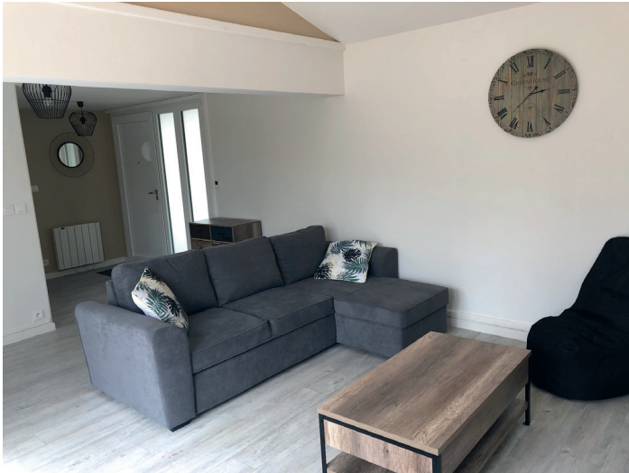
Hall d'entrée / salon