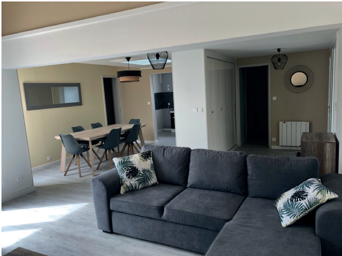
Pièce de vie