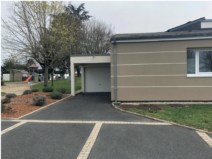
Façade avant / allée de garage