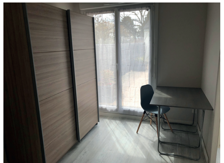
Chambre 4 / armoire