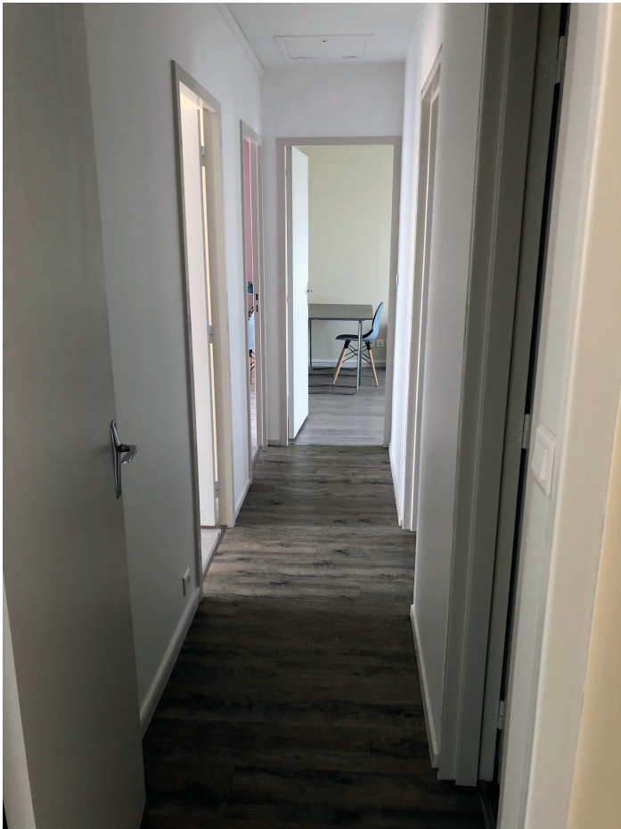
Couloir desservant l'espace nuit